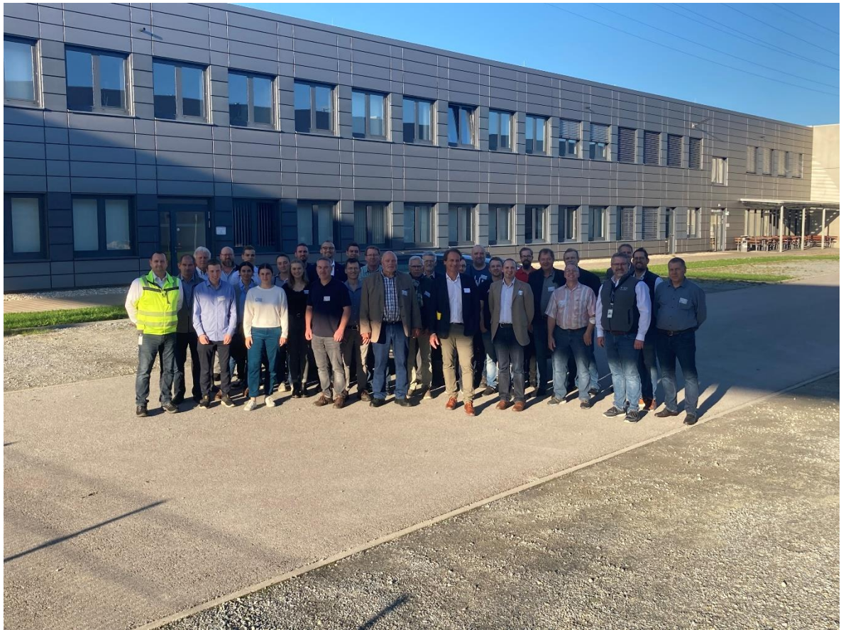
zahlreiche Teilnahme bei der Führung mit dem LBM Bezirk Niederbayern/Oberpfalz