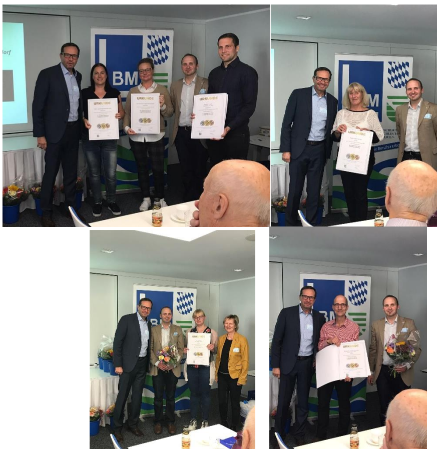
Hervorragende Qualität DLG Prämierung: Käserei Loose, Sachsenmilch, TMA, Vogtlandmilch, Molkerei Hainichen-Freiberg und Heinrichsthaler Milchwerke