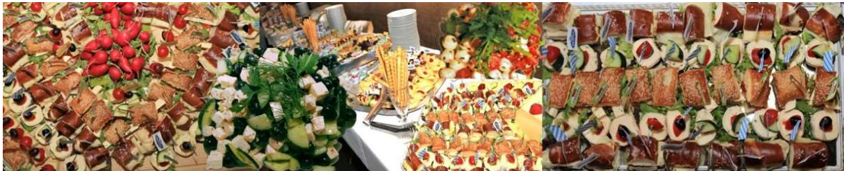
Käsebuffet als Stärkung für die Milchwirtschaftler und Gäste.

Nach einer ca. zweistündigen interessanten Führung durch die Produktionslinien der GOLDSTEIG Käsereien war der Appetit der Verbandsmitglieder groß. Da war die nächste Station, das Hotel Randsberger Hof, gut vorgeplant, denn dort wartete ein reichhaltiges und sehr schmackhaftes Käsebuffet auf die Teilnehmer.