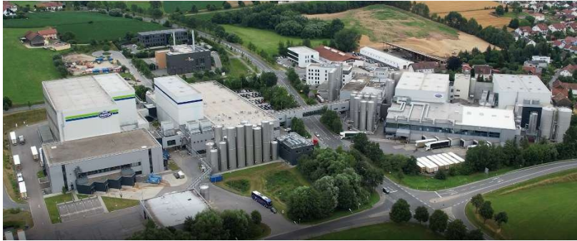
Zentrale der GOLDSTEIG Käsereien Bayerwald GmbH in Cham.

Nach einer ca. zweistündigen interessanten Führung durch die Produktionslinien der GOLDSTEIG Käsereien war der Appetit der Verbandsmitglieder groß. Da war die nächste Station, das Hotel Randsberger Hof, gut vorgeplant, denn dort wartete ein reichhaltiges und sehr schmackhaftes Käsebuffet auf die Teilnehmer.